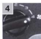
4 Установить максимальную скорость обдува