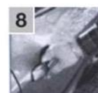
8 Закрывать все окна и двери, оставить двигатель включенным минимум ещё на 10 мин