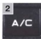
2 Выключить кондиционер