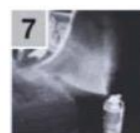
7 Установить баллончик на пол переднего пассажирского сиденья, открыть и зафиксировать кнопку баллончика