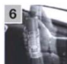
6 Тщательно встряхнуть баллончик