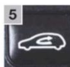
5 Включить внутреннюю циркуляцию воздуха