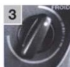
3 Установить минимальный уровень температуры