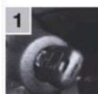
1 Завести мотор